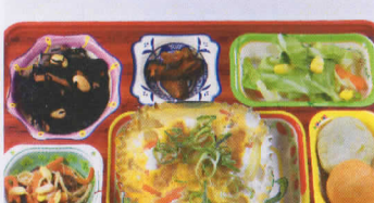
11木 豚カツ甲とし 熱量941kcal/蛋白質33g/脂肪29g/炭水化物132g/食塩3.5g