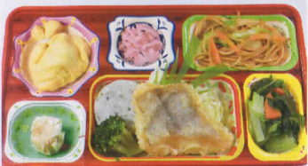
1月 白身魚の天ぷら 熱量840kcal/蛋白質24g/脂肪22g/炭水化物131g/食塩3.3g