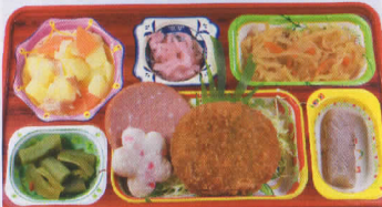
5金 メンチカツ 熱量845kcal/蛋白質22g/脂肪20g/炭水化物137g/食塩4.7g