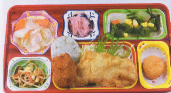
24水 ササミの天ぷら 熱量944kcal/蛋白質32g/脂肪28g/炭水化物136g/食塩3.2g