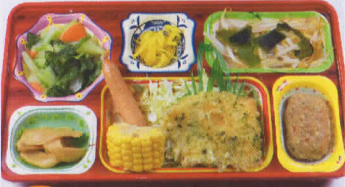
4木 イカの磯辺揚げ 熱量824kcal/蛋白質28g/脂肪21g/炭水化物125g/食塩2.7g