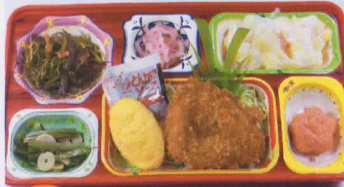
17水 豚カツ 熱量897kcal/蛋白質25g/脂肪29g/炭水化物129g/食塩3.5g