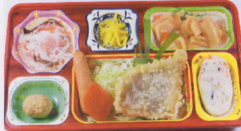
18木 白身魚の天ぷら 熱量840kcal/蛋白質27g/脂肪21g/炭水化物130g/食塩3.5g