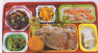
25木 豚肉の生姜焼き 熱量848kcal/蛋白質22g/脂肪24g/炭水化物126g/食塩3.1g