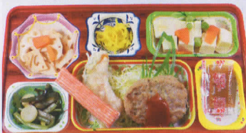
8月 ハンバーグステーキソース 熱量848kcal/蛋白質23g/脂肪22g/炭水化物135g/食塩3.8g