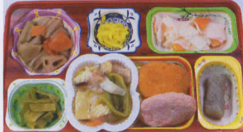
16火 八宝菜 熱量829kcal/蛋白質18g/脂肪22g/炭水化物131g/食塩3.9g