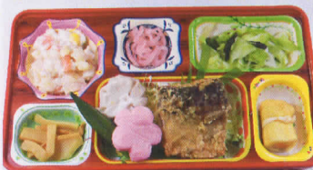
9火 サバの竜田揚げ 熱量904kcal/蛋白質26g/脂肪27g/炭水化物133g/食塩3.2g