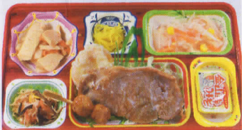
2火 豚焼き肉 熱量869kcal/蛋白質25g/脂肪24g/炭水化物131g/食塩3.6g