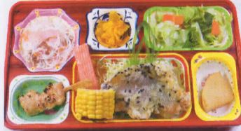
22月 白身魚のゴマ揚げ 熱量832kcal/蛋白質26g/脂肪22g/炭水化物128g/食塩2.4g