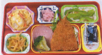
15月 アジフライ 熱量787kcal/蛋白質23g/脂肪21g/炭水化物116g/食塩4.0g