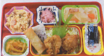
3水 若鶏の竜田揚げ 熱量877kcal/蛋白質26g/脂肪28g/炭水化物127g/食塩4.0g