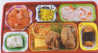
10水 若鶏の唐揚げ 熱量886kcal/蛋白質30g/脂肪27g/炭水化物125g/食塩2.6g