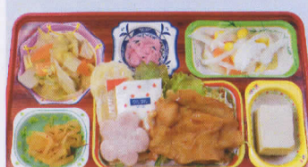
19金 チキン南蛮 熱量924kcal/蛋白質28g/脂肪31g/炭水化物128g/食塩3.4g