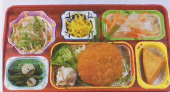
12金 ゴマ油香る塩じゃがコロッケ 熱量814kcal/蛋白質17g/脂肪21g/炭水化物139g/食塩2.8g