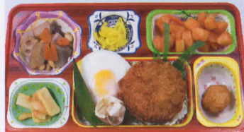
26金 ベーコンマヨカツ 熱量911kcal/蛋白質30g/脂肪23g/炭水化物127g/食塩3.9g