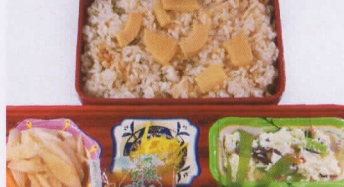
23火 おろしハンバーグ 熱量881kcal/蛋白質23g/脂肪24g/炭水化物142g/食塩3.5g