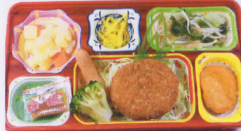
30火 チーズインメンチカツ 熱量859kcal/蛋白質22g/脂肪22g/炭水化物139g/食塩3.7g